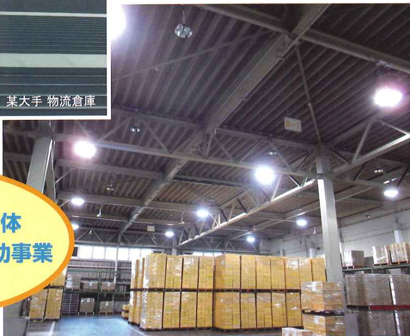
太陽光照明の設置事例②