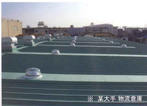
※ 某大手 物流倉庫