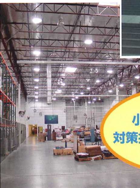
太陽光照明の設置事例①